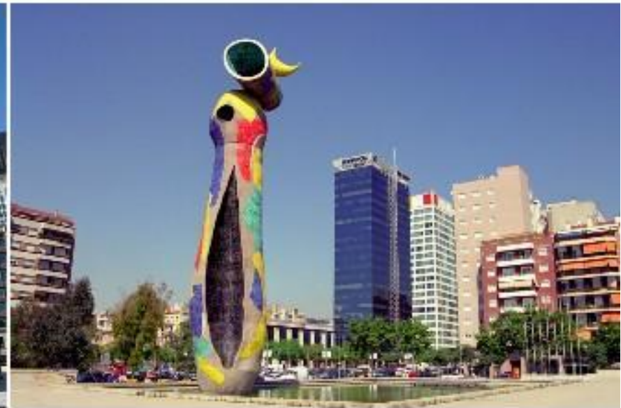
Dona i Ocell Barcelona