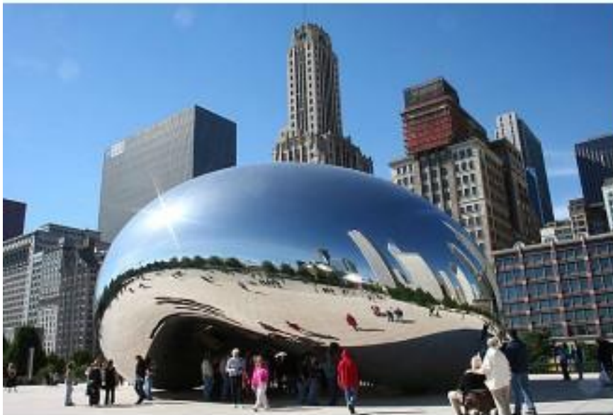
The Bean Chicago

Los objetos completan su razón de ser desde la perspectiva de las personas, desde su capacidad para concebir lo invisible y lo inmaterial que nos rodea.