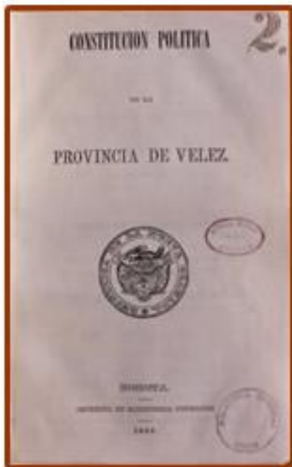
Constitución Política de la Provincia de Vélez Bogotá Imprenta de Echeverría Hermanos, 1853. Fondo Anselmo Pineda, Biblioteca Nacional de Colombia, Bogotá.