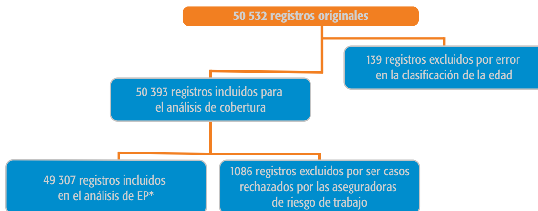
GRÁFICO 1. Cantidad de registros analizados y exclusiones realizadas.